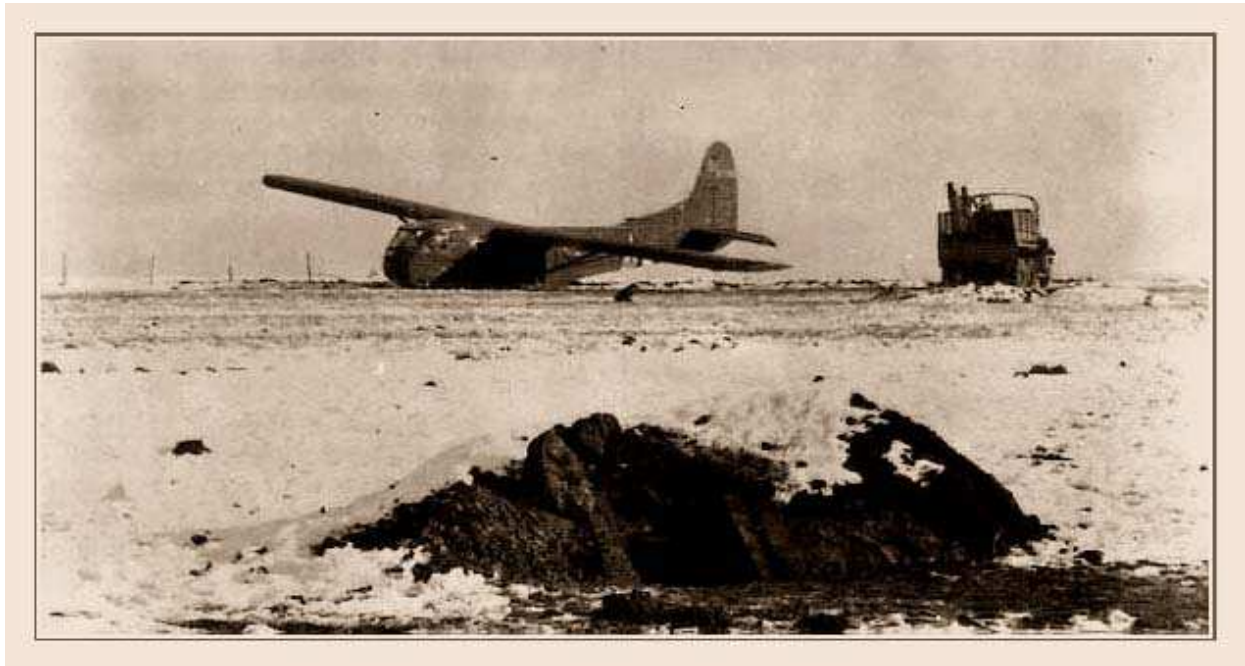
Planeur d'assaut CG-4A dans le périmètre de Bastogne le 26 décembre. La livraison d'obus à été faite en direct à une batterie ! En avant plan, une soute à munition...

s'étaient mis en attente d'une probable suite. C'est ainsi qu'un rideau de tir d'armes légères automatiques attendent nos courageux pilotes. Les binômes volaient à 200 mètres d'altitude et donc plus vulnérables. Plusieurs planeurs seront touchés dont un qui présentait pas moins de 70 impacts !