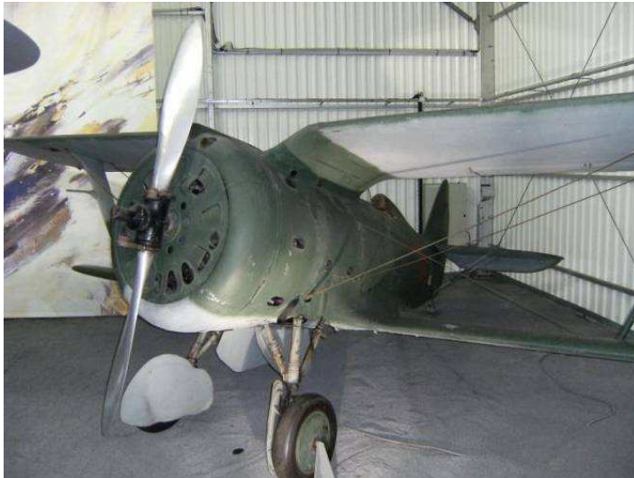
I- 15 MAE Le Bourget

Des avions c'est bien, mais il faut aussi des pilotes. Si la Russie formera la grande majorité des aviateurs Républicains, la France va cependant participer elle aussi de manière non négligeable mais toujours 'discrète' à la formation de pilotes espagnols en lutte contre Franco. En réponse aux violations des traités signés avec l'Allemagne et l'Italie, Léon Blum décide bientôt de pratiquer une politique de non-intervention dite 'élastique' ou 'relâchée'. Des hommes comme Pierre Cot et Jean Moulin vont être chargés de la mettre en place. Des avions français seront livrés à l'Espagne et grâce à des circuits tout à fait 'officieux' des pilotes Républicains vont être formés en France. On va les retrouver à Bourges, Orly, Agen, Villeneuve-sur-Lot, Royan, Meaux-Esbly et Boissy-le-Châtel ( Coulommiers ).